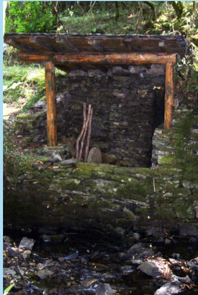
En Pumares houbo actividade ferreira. A carón do río podemos ver unha moa de afiar e os restos dun mazo.