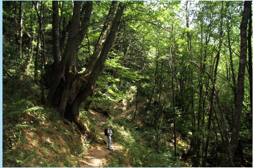
Camiñando polo souto na subida a Busqueimado