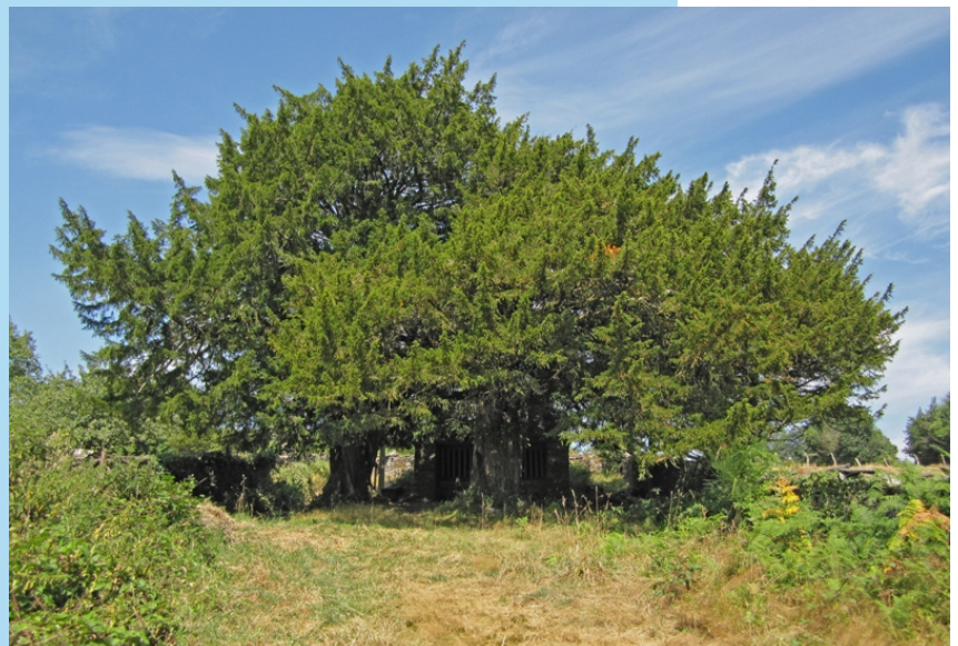
Teixos de Busqueimado, de 3,80 e 3,74 m de perímetro