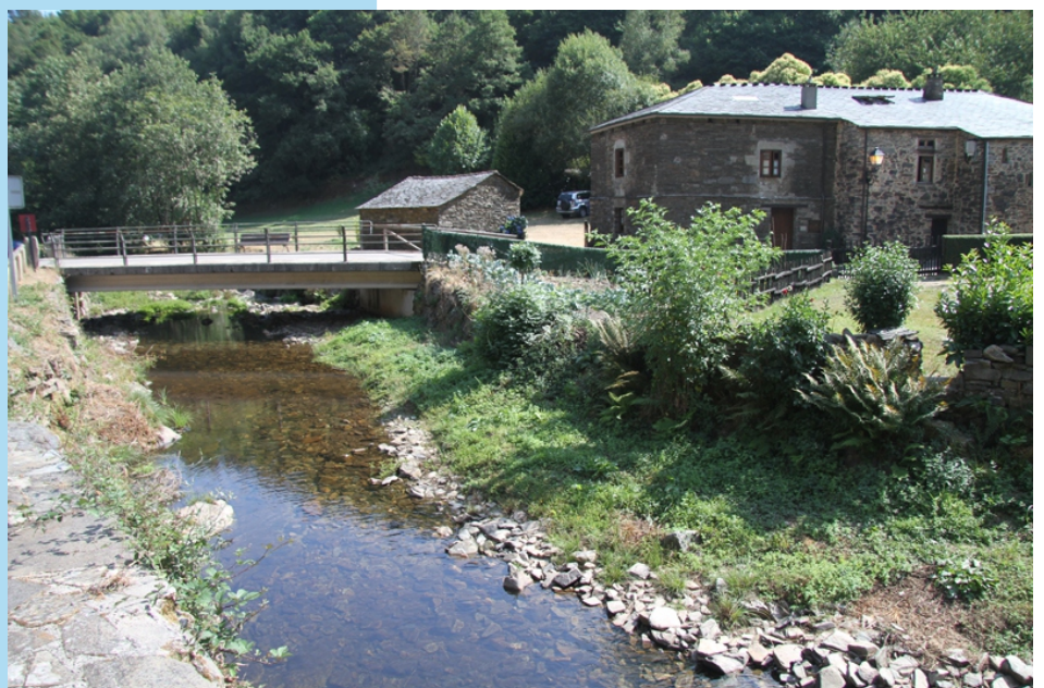
Pumares, co río Agüeira, no comezo da ruta.