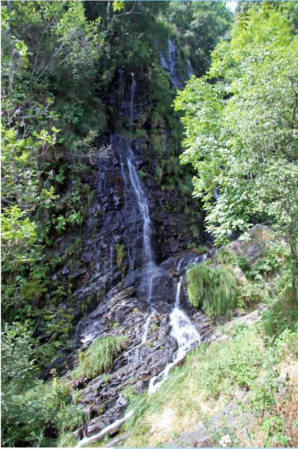
A Seimeira no verán